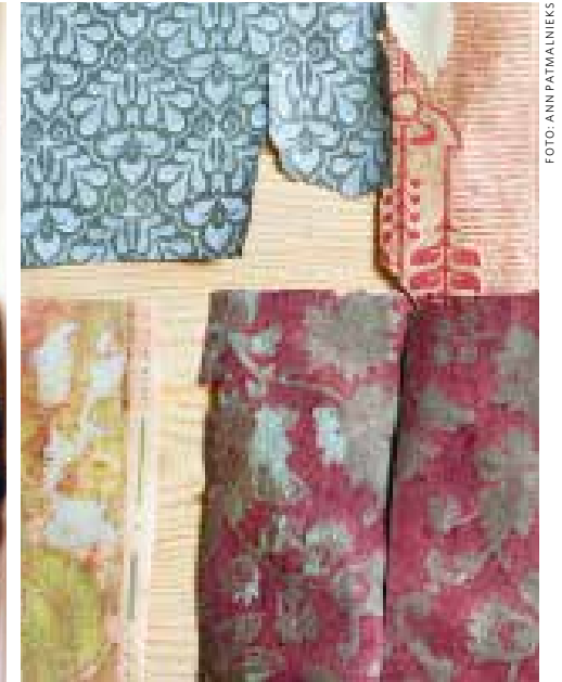
Tapeterna har suttit i lager på lager.

laga skiftet delade åtta fristående bönder på marken. Det fanns åtta släkter och boningshus och totalt 60–70 olika byggnader. Vid laga skiftet 1850, när de andra gårdarna flyttades ut, fick Sexmångsgården vara kvar. Informationen har de hittat i ett 150-sidigt dokument på Lantmäteriet.