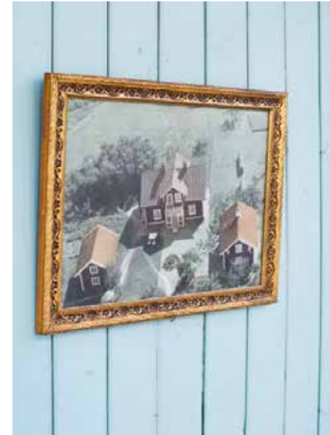
Gamla flygfoton inspirerar.

I sin dator har han samlat all information han kunnat hitta om gårdens historia. Före